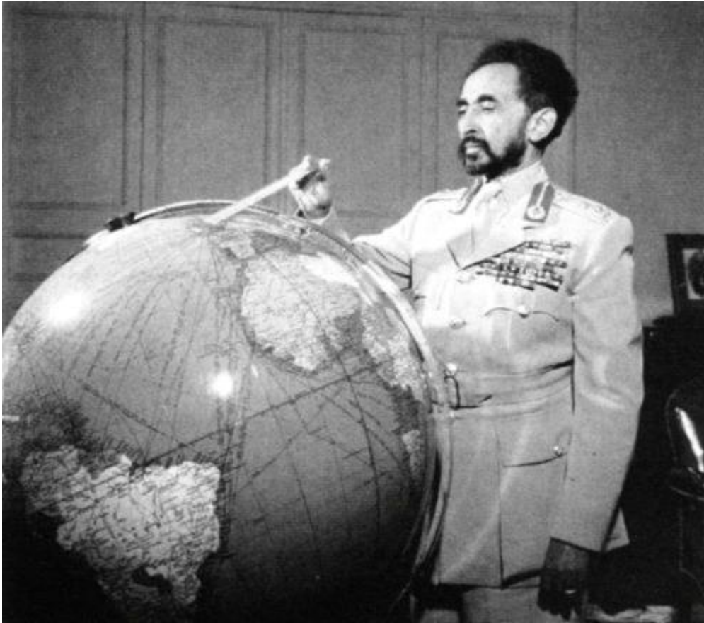
L'empereur Haïlé Sélassié

Après la Deuxième Guerre mondiale, Sélassié se tourne donc vers les Etats-Unis. Quelles seront leurs relations ?