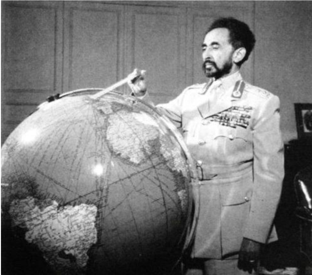
L'empereur Haïlé Sélassié

Après la Deuxième Guerre mondiale, Sélassié se tourne donc vers les Etats-Unis. Quelles seront leurs relations ?