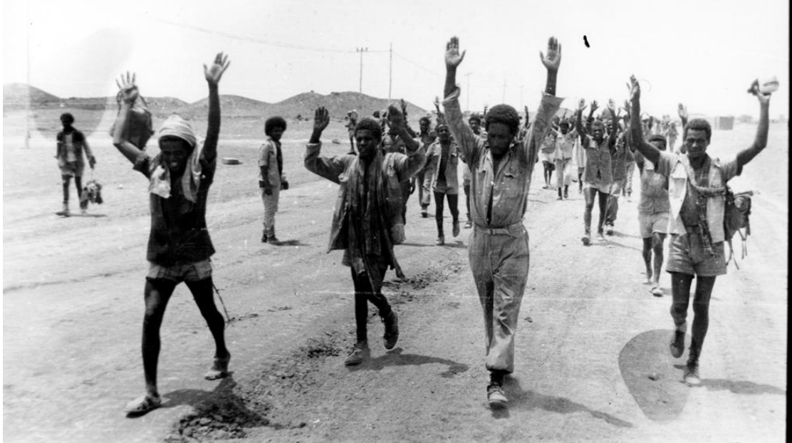
جنود اثيوبيون يستسلمون للجيش الشعبي الارتري

كانت جبهة " نادو" تشكل العمود الفقري للنظام العسكري الاثيوبي، و تعتبر اقوى واكبر تجمع عسكري لوحدات الجيش الاثيوبي في جبهة واحدة. وقد بلغ طول انتشار قوات تلك الجبهة بـ 165 كم تبدأ من سهول شاطئ البحر الاحمر شرقا وحتى مناطق عنسبا غربا، وبعمق حوالي 100 كم .