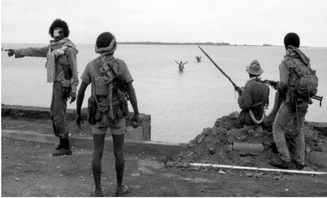
مشهد من معركة تحرير ميناء مصوع

وقد تمكنت فيها قوى الثورة الارترية من ارباك النظام العسكري الاثيوبي، لتتحول اوضاعه