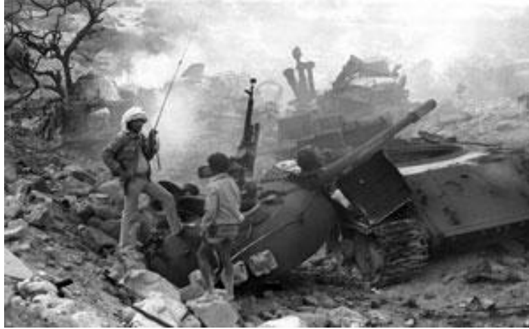
نادو مقبرة الدبابات الاثيوبية

لم تنته المعارك على طول إمتداد جبهة "نادو"، إلا في صباح يوم 19/03/1988م، اي في اليوم الثالث من اشتعالها، وفي أقل من نصف ساعة تمكنت وحدات من الجيش الشعبي من اجتياح خطوط دفاعات الجيش الاثيوبي في مدينة افعبت، ليتم لها السيطرة التامة على المدينة، والإستيلاء على كافة الإمدادات العسكرية التي كانت مكدسة في مخازن معسكرات "نادو"، ولتعزز بذلك القدرة النارية للجيش الشعبي لتحرير ارتريا، والذي كان هذا احد اهداف تدمير جبهة "نادو"، وتطبيقا لشعار "مواجهة العدو بسلاحه وعتاده".