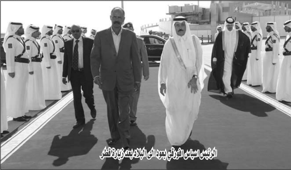
الرئيس السيسى الشرقى يعود الى البلاد بعد زيارة قطر