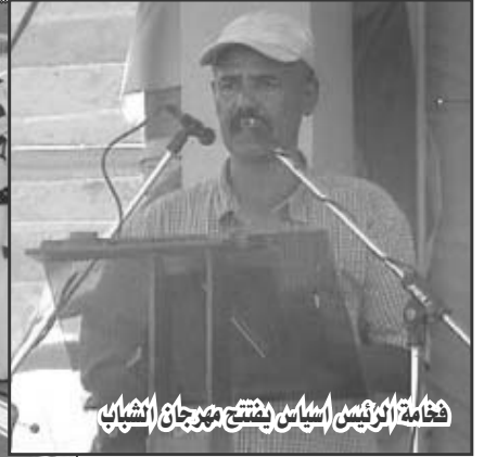
فخامة الرئيس اسيس يفتتح مهرجان الشباب

للخدمة الوطنية. بحضور فخامة الرئيس اسيس افورقي والوزراء وقادة الجيش وحكام الاقاليم وكبار المسؤولين في الجبهة الشعبية للديمقراطية والعدالة والاتحادات الوطنية وآلاف المواطنين من الداخل