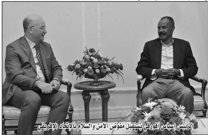
الرئيس اسياق افورقي يستقبل مفوض الأمن والسلام بالارتقاء الإفريقي

يناير هنا فخامة الرئيس اسياق افورقي الشعب الإرتري وقوات دفاعه الباسلة بمناسبة العام الجديد. وقدم الرئيس اسياق افورقي تهانيه الحارة للشعب الإرتري في الداخل والمهجر ، للتقدم الذي يحرزه في التنمية والتصدي في المجالات كافة.