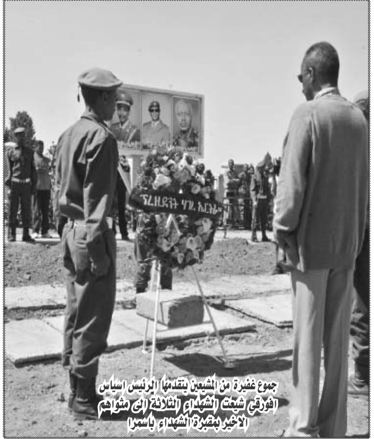
جموع غفيرة من الشعبين يتقدمها الرئيس اسيااس افورقي شيعت (شهداء) (اتلافة الى مثوالم) الاخير بمقبرة الشهداء باسمرا

يجري خلالها مباحثات مع الرئيس السوداني عمر حسن احمد البشير لتقوية