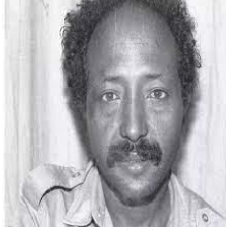
الشهيد البطل ابراهيم عافه

بطولاتهم وتفانيهم، وإخلاصهم، ومحبتهم للإنسان الارترى، والأرض الارترية الطيبة، ورؤيتهم الصادقة في كيفية تحقيق ما يصبوا إليه شعبنا الارترى. وإنني وبهذه المناسبة الجلييلة، مناسبة يوم الشهداء لا يسعني إلا ان اقف إجلالا وتقديرا لتضحياتهم بكل ما كانوا يملكون.